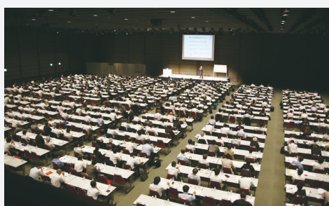
前回の東京会場の様子